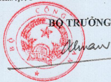
Đại tướng Lương Tam Quang